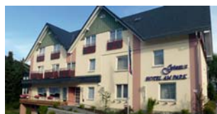
HOTEL AM PARK Willingen/Upland