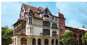
GÖBEL'S VITAL HOTEL Bad Sachsa/Harz