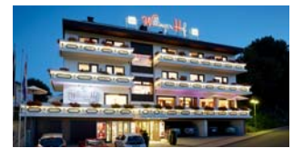
WILLINGER HOF Willingen/Upland