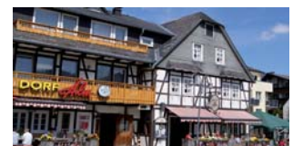
GÄSTEHaus DORF ALM Willingen/Upland