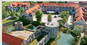
GÖBEL'S SCHLOSSHOTEL Friedewald b. Bad Hersfeld