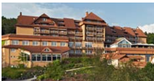
GÖBEL'S HOTEL RODENBERG Rotenburg a.d. Fulda