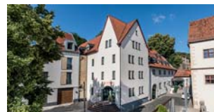
HOTEL AM MARKT Eisenach