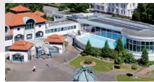
GÖBEL'S HOTEL AQUAVITA Bad Wildungen-Reinhardshausen