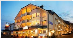
GÖBEL'S LANDHOTEL Willingen/Upland