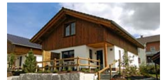
CHALET-PARK DIEMELSEE Diemelsee-Heringhausen