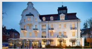
GÖBEL'S HOTEL QUELLENHOF Bad Wildungen