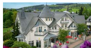
PARK RESORT Willingen/Upland