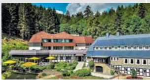
ROMANTIK HOTEL STRYCKHAUS Willingen/Upland

Hauptstraße 4 D-34537 Bad Wildungen- Reinhardshausen Tel. +49(0)5621 7860 Fax +49(0)5621 786160 info@goebels-aquavita.de www.goebels-aquavita.de