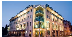
GÖBEL'S SOPHIENHOTEL Eisenach