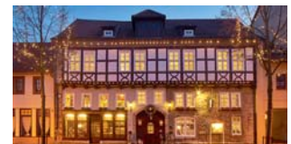
BRAUHAUS ZUM LÖWEN Mühlhausen/Thüringen