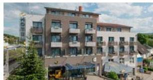
POSTHOTEL ROTENBURG Rotenburg a.d. Fulda