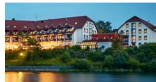
GÖBEL'S SEEHOTEL DIEMELSEE Diemelsee-Heringhausen